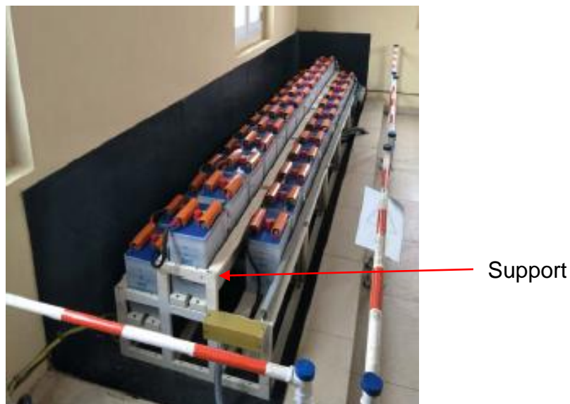
Figure 6 : Support métallique

Cette prestation consiste à concevoir, acquérir les matériels nécessaires, les acheminer sur le site des prestations, réaliser les travaux d'assemblage (soudure, vissage, rivetage, etc.), de protection anti rouille et peinture de couleur blanche du support métallique dans la zone des batteries, qui permettra de ranger l'ensemble des batteries nécessaires à l'alimentation des équipements des services auxiliaires à courant continu du barrage. Le support sera constitué de 3 rangées comme illustrée par la figure ci-dessous. Les dimensions du support sont 4175(L)x746(l)x783(h).