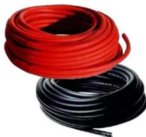
Figure 3: Câble de raccordement des batteries

Cette prestation consiste à fournir, transporter sur le site des prestations et à installer deux (02) bobines de câbles de raccordement des batteries entre elles de section 70mm 2 et de couleurs rouge et noire. La photo ci-dessus illustre lesdits câbles de raccordement.