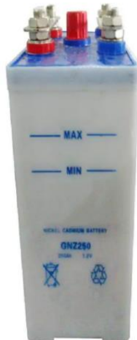
Figure 2: Batterie Ni-Cd

Cette prestation consiste à fournir, transporter sur le site des prestations et installer cinquante (50) batteries GNZ-250Ah, 1,2V, Nickel-Cadmium avec leurs accessoires (couverture anti-poussière, plaque de pont, densimètre, tablier, gant et lunettes de protection, clé à écrou, clé à bouchon d'air et électrolyte) pour l'alimentation des services auxiliaires à courant continu du barrage de Lom Pangar. L'illustration de la batterie est présentée ci-après :