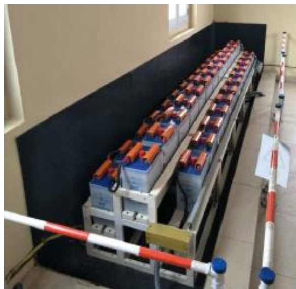
Figure 1: Espace d'entreposage des batteries

Cette prestation consiste à fournir, transporter sur le site des prestations et installer un tapis de revêtement mural S-TD ignifugé de couleur noire, conforme à la norme non-feu M1, qui recouvrira le sol et les deux murs adjacents de l'espace occupées par les batteries dont les spécifications techniques sont BST-MFF-0.6 / 5000mm(L)×1000mm(l) ×1000mm(h). Il est illustré sur la figure ci-dessous.