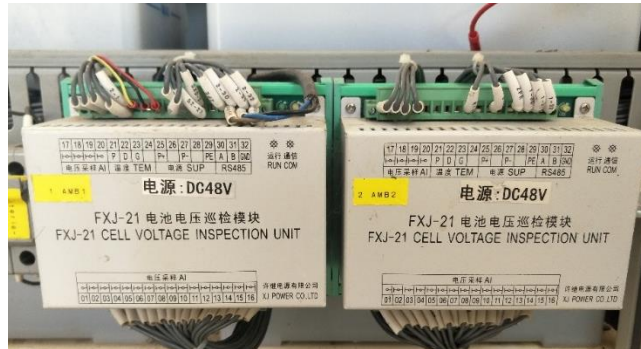
Figure 4: Unités d'inspection de la tension des batteries

Il s'agira ici de fournir, de transporter sur le site des prestations et d'installer deux (02) unités de détection de batterie FXJ-21 DC48V qui auront pour rôle de contrôler la tension à la sortie des batteries. La photo ci-dessous illustre les unités d'inspection de la tension des batteries.